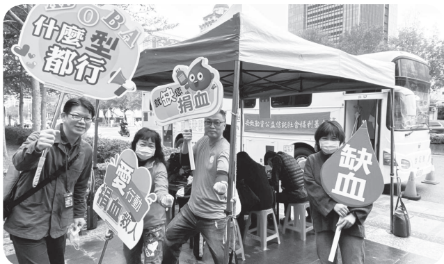
▲捐血救人愛行動，安致讓愛不罕見。

現場社福團體產品義賣，包括台南新東國小的心動玉白米、紅鼻子愛心提袋、蘆葦女力公益信託咖啡麻布袋製成的耶誕樹、中廣響應三菱除濕機等。安致發起捐血便捐公益金予基金會的活動，抽出兩台由胡笙大師贊助之薩克斯風造型揚聲器。當天的200袋熱血，為本會募得11萬5千元，感謝安致勤資公益信託、王陳靜文社會福利基金會、王元熹公益信託、鄭高輝慈善基金會、胡笙藝術中心及台北捐血中心的熱情贊助。