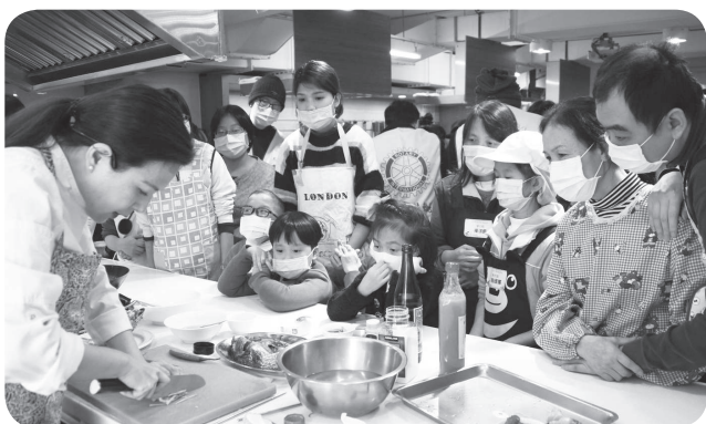
▲士林扶輪社社友們與病家們仔細記錄老師料理的步驟。

評審們花了不少時間評選，最終選出「廚藝精湛獎」、「最佳創意獎」、「團隊合作獎」，士林扶輪社特別加碼紅包，以及郭元益食品贊助的禮盒，讓病家們滿載而歸。您的關懷，讓許多罕病家庭備受暖心。