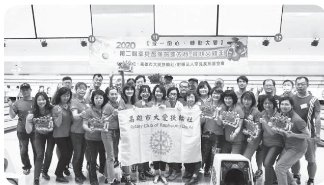
▲2020年「投一份心·轉動大愛」高雄市大愛扶輪與病友家庭一同參與保齡球活動。