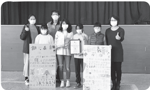
▲感謝南投水里國小師生餅乾義賣助罕病。

罕見疾病病友終身與疾病共處，水里國小的師生們看見病友的需求，2017至2018年連續捐贈本會，發揮小愛化成大愛的精神，透過義賣讓更多人關注罕病議題，用實際行動幫助罕病，2020年本會再次獲得捐贈實在揪感心，感謝南投水里國小，讓愛從校園蔓延。