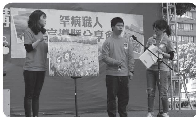
▲藝術心世界－螢火照亮生命力，罕病職人分享創作歷程。

罕見職人攤位，各有特色、職人展現才能，包括陶藝品、精緻手工布包、手繪卡片、美味烘培，來至本會罕見職人們的巧手，職人們包括病友及家屬，利用有限的時間和體力發揮所長。基金會期待推出職人推廣方案，讓罕家展現才能、創造就業機會。感謝台中廣三SOGO的用心，提供優質的場地呈現展覽以及辦理分享會，讓社會大眾真實認識罕病，罕病路上有您們陪伴不孤單，也讓愛不罕見！