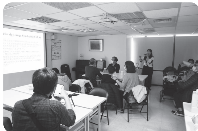
▲Cornelia de Lange氏症候群醫療座談。