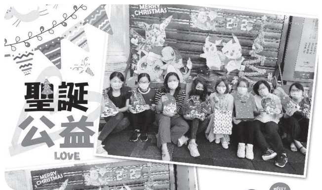
▲獅子王Live互動美語福袋助罕病活動圓滿成功。

獅子王Live互動美語除了協助孩子們課業外，落實自己的力量幫助有需要團體，這幾年選擇本會作為愛心合作單位，是因為看見病友們與疾病共處下，仍不放棄學習的精神，深表認同與敬佩，希望藉此勉勵更多學子培養愛與尊重的信念，他們更曾在2019至2020年歲末義賣共捐贈28,000元，鼓勵家長與孩子以實際行動幫助罕病。再次感謝獅子王Live互動美語，透過教育的力量，讓愛的教育向下延伸，將善良的種子深植在孩子們內心，為寒冬中送來一道暖光，讓愛從罕見開始！