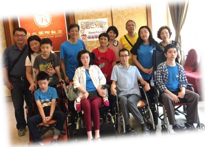
2017 年聚會 ~ 快樂聚餐