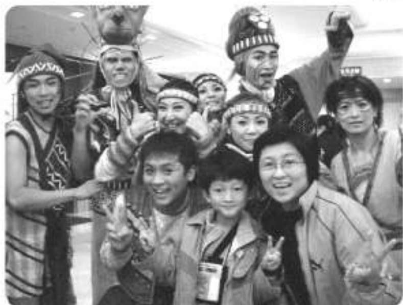
◀ 雲豹仔仔（前中）被如果劇團的哥姊熱情包圍

森林裡有個小獵人奇里乖，他膽小怕事、討厭爬山，爲了熱愛森林裡的朋友黑熊、蜜蜂與梅花鹿，也爲了協助爺爺揪出出賣族人的大壞蛋，最後竟然變成穿山甲，拯救森林——活潑的舞蹈、童謠式的音樂、新奇的舞臺設計，再加上緊湊饒富保育概念的劇情，讓大小朋友皆隨著劇中人物-奇里乖歷經一場充滿花朵、山豬、黑熊、雲豹及獵人的新奇之旅，和調皮的奇里乖學會如何爬山、如何觀察大自然、尊敬大自然，進而學習「尊重長輩、愛護資源」的觀念，也從大壞蛋-「很準」的角色上看到大家應該「謙虛待人、勇於認錯」的價值觀。