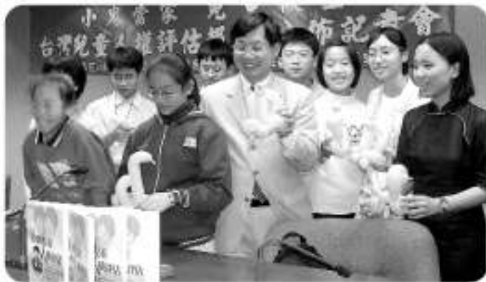
▲敦化國小的兒童代表是「台灣兒童人權評估」發表會的主角

嚴肅的立法院，四月四日上午從第十會議室裡，傳來陣陣悠揚的長笛聲，還有低沉的黑管也唱起歌來，不一會兒，五顏六色的汽球化作一隻隻造型可愛的動物，一群孩子聚在一起，展現屬於孩子們的豐富才藝，還以中英文雙語，發表屬於他們的「兒童宣言」，這是怎麼一回事兒？