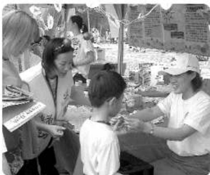
▲闖關成功的小朋友由本會通傳諮詢員貼上榮譽貼紙

在問到願不願意和罕病小朋友作朋友時，許多天真的小臉爬滿猶豫、害怕的問號，在經過本會工作人員仔細的解說後，孩子們和家長都了解到：「罕見疾病是基因遺傳的疾病，不會傳染的，可以放心和他們一起遊戲學習，並和他們當好朋友喔！」■